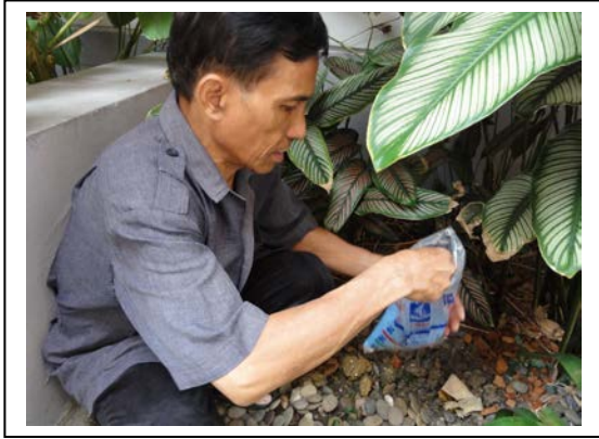
5. ใส่ปุ๋ย เพื่อบำรุงบริเวณรอบ ๆ โคนต้นไม้ทั่ว