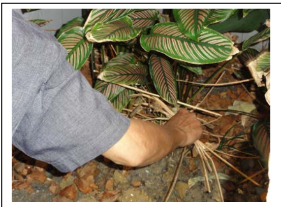
3. เก็บเศษกิ่ง ก้าน ใบไม้ ใต้โคนต้นไม้ให้เรียบร้อย