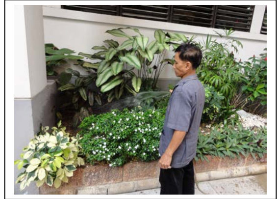
6. รดน้ำให้ชุ่มชื้น ทั่วทั้งบริเวณสวน