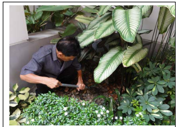
4. พรวนดิน รอบโคนต้นไม้