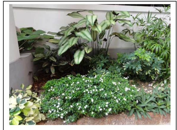
8. ได้สวนหย่อมสวย สะอาด สดชื่น สบายตาน่ามอง