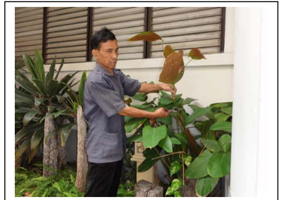
2. ตัดแต่งกิ่งแห้ง ใบแห้ง ออก