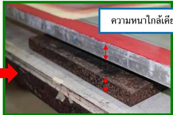
ความหนาใกล้เคียงหรือเท่ากัน

4. นำชิ้นงานที่พิมพ์วางบนแท่นรองชิ้นงานและทำการพิมพ์