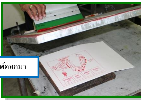
ชิ้นงานที่พิมพ์ออกมา

4. นำชิ้นงานที่พิมพ์วางบนแท่นรองชิ้นงานและทำการพิมพ์