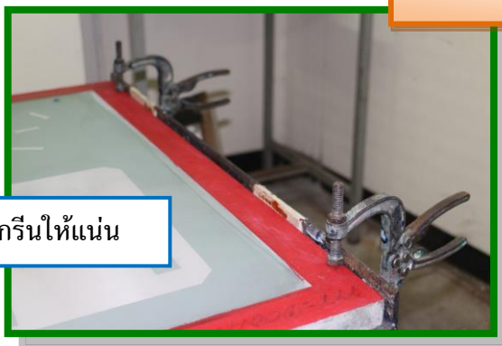
ยึดบล็อกสกรีนให้แน่น