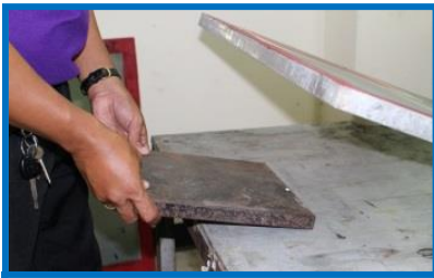
เตรียมวัสดุรองชิ้นงาน

3. นำวัสดุรองชิ้นงานที่มีความหนาใกล้เคียง หรือเท่ากับความหนาของบล็อกพิมพ์