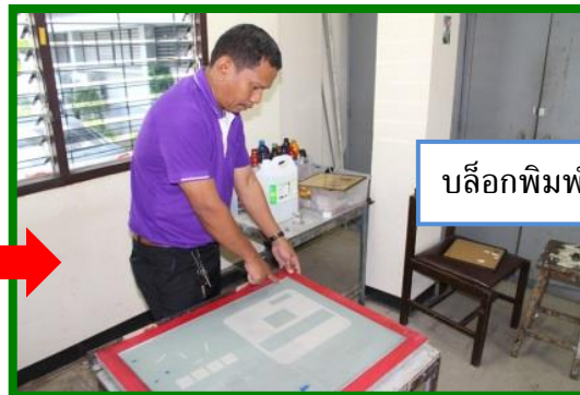
บล็อกพิมพ์ที่กลับด้านที่ถูกต้อง