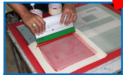
ทดลองพิมพ์ชิ้นงาน