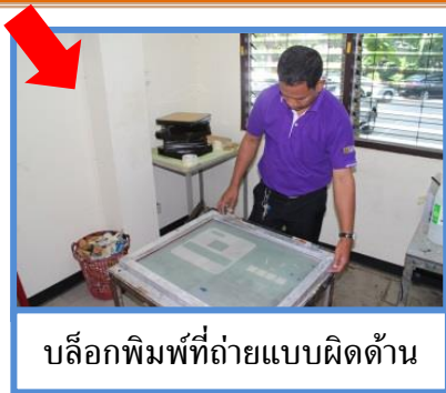
บล็อกพิมพ์ที่ถ่ายแบบผิดด้าน