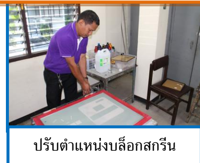
ปรับตำแหน่งบล็อกสกรีน